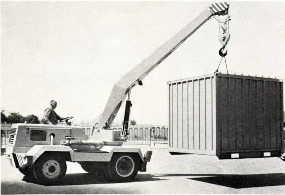
LIEBHERR-Mobilkran AK 50 B bei Verladearbeiten