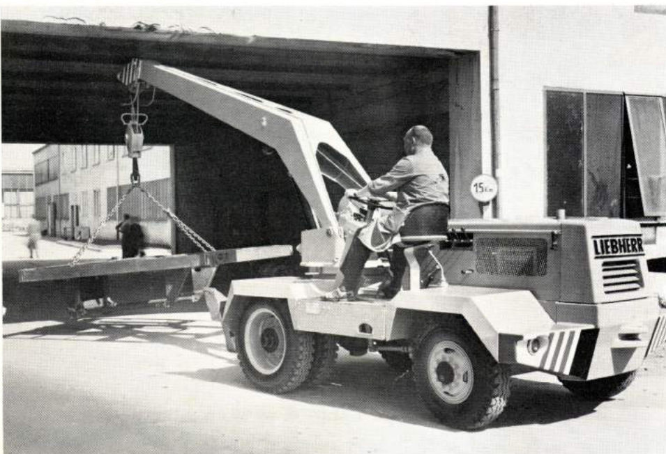
LIEBHERR-Mobilkran AK 50 B beim Passieren einer niedrigen Durchfahrt

Der AK 50 B entspricht mit den Normalausrüstungen als Arbeitsmaschine den neuesten Bestimmungen der StVZO. Der Ausleger kann beim Befahren öffentlicher Straßen nach hinten abgeschwenkt werden, so daß keine über das zulässige Maß vorragenden Teile vorhanden sind. Radverkleidungen gehören ebenso zum serienmäßigen Lieferumfang wie Betriebsstundenzähler, komplette Beleuchtungsanlage, Arbeitsscheinwerfer, Boschhorn, Endsignalschaltung, Lastmoment-sicherung (bei Abstützung automatisch umschaltend), umfangreiches Werkzeug und Lackierung.