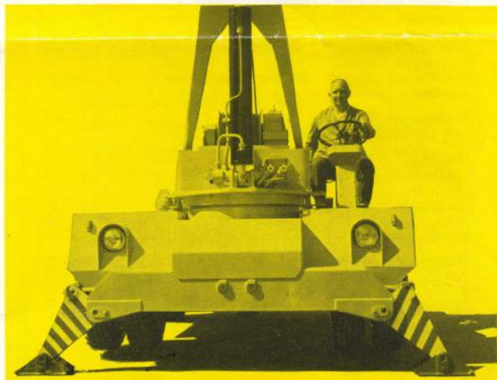
Der AK 50 B kann ohne weiteres mit einer hydraulischen Abstützung für die Antriebsachse versehen werden, was eine Tragkraftsteigerung von 1 t ergibt. Die Abstützung wird vom Führerstand aus bedient und erfordert somit keinen nennenswerten Zeitverlust. Die Abbildung zeigt das abgestützte Gerät von vorne. Deutlich zu sehen die geschützt untergebrachten Scheinwerfer auf den serienmäßigen Radverkleidungen, der doppelreihige Kugeldrehkranz und das komplette Drehgestell.