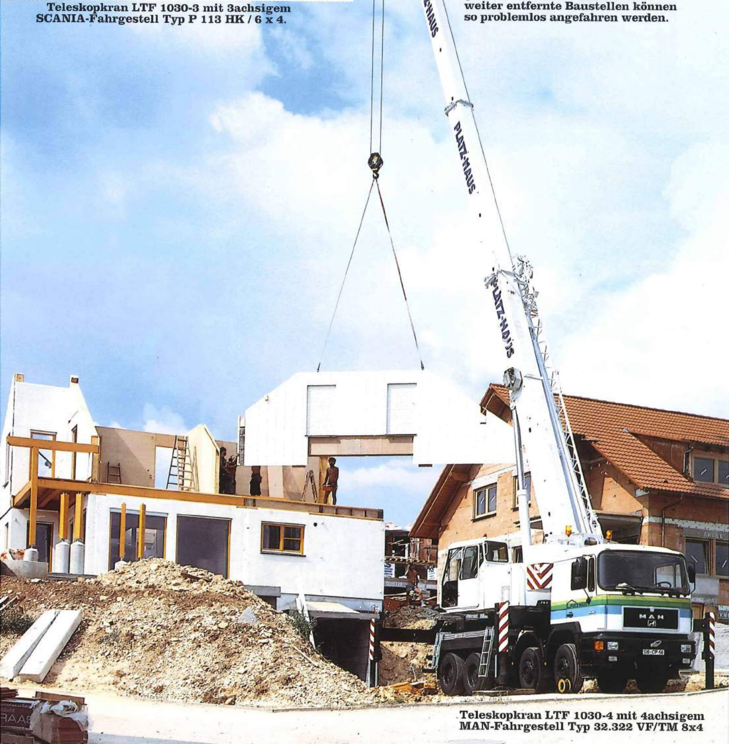
Teleskopkran LTF 1030-4 mit 4achsigem MAN-Fahrgestell Typ 32.322 VF/TM 8x4

In 1 bis 1,5 Tagen wird heute ein Fertighaus gestellt. Hundert Hübe und mehr absolviert der Kran in kürzester Zeit. Mit Präzision, Schnelligkeit und Sicherheit bewegt ein LTF-Kran täglich oft zehn Stunden und länger verglaste Wandelemente und getäfelte Installationswände. Und zieht im Eiltempo Paletten mit Dachpfannen und Isoliermaterial in die Höhe. Dann rollt der Kran zweihundert Kilometer - manchmal mehr - zum nächsten Einsatz. Auf Grund des günstigen Gesamtgewichts kann den 3- und 4achsigen Kranen eine bundesweite Dauerfahrerlaubnis nach § 29 StVZO erteilt werden. Auch weiter entfernte Baustellen können so problemlos angefahren werden.