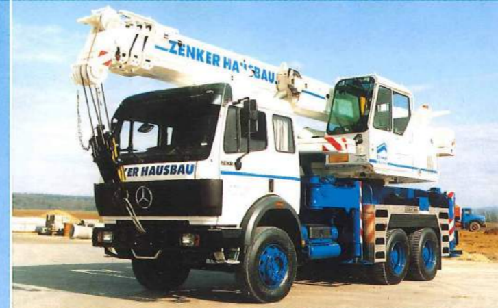
Teleskopkran LTF 1030-3 mit 3achsigen Daimler-Benz-Fahrgestell Typ 2631 K / 6 x 4.

Was das Fahrgestell an Leistung, Fahrkomfort und Sicherheit bietet, sagt Ihnen der Hersteller. Wir garantieren für den Kranaufbau eine moderne und funktionelle Technik: mit robustem Liebherr-Dieselmotor, feinfühler Load-Sensing-Kransteuerung, hydraulischer Ballastvorrichtung, Komfort-Krankabine mit integrierter Armlehnensteuerung, LICCON-Überlastanlage mit serienmäßigem Testsystem und den verwindungssteifen Teleskopausleger, verlängerbar mit einer bis 14,4 m langen Doppelklappspitze für 42 m Hubhöhe und 36 m Reichweite.