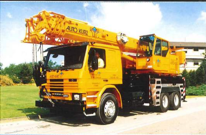
Teleskopkran LTF 1030-3 mit 3achsigem SCANIA-Fahrgestell Typ P 113 HK / 6 x 4.

In 1 bis 1,5 Tagen wird heute ein Fertighaus gestellt. Hundert Hübe und mehr absolviert der Kran in kürzester Zeit. Mit Präzision, Schnelligkeit und Sicherheit bewegt ein LTF-Kran täglich oft zehn Stunden und länger verglaste Wandelemente und getäfelte Installationswände. Und zieht im Eiltempo Paletten mit Dachpfannen und Isoliermaterial in die Höhe. Dann rollt der Kran zweihundert Kilometer - manchmal mehr - zum nächsten Einsatz. Auf Grund des günstigen Gesamtgewichts kann den 3- und 4achsigen Kranen eine bundesweite Dauerfahrerlaubnis nach § 29 StVZO erteilt werden. Auch weiter entfernte Baustellen können so problemlos angefahren werden.