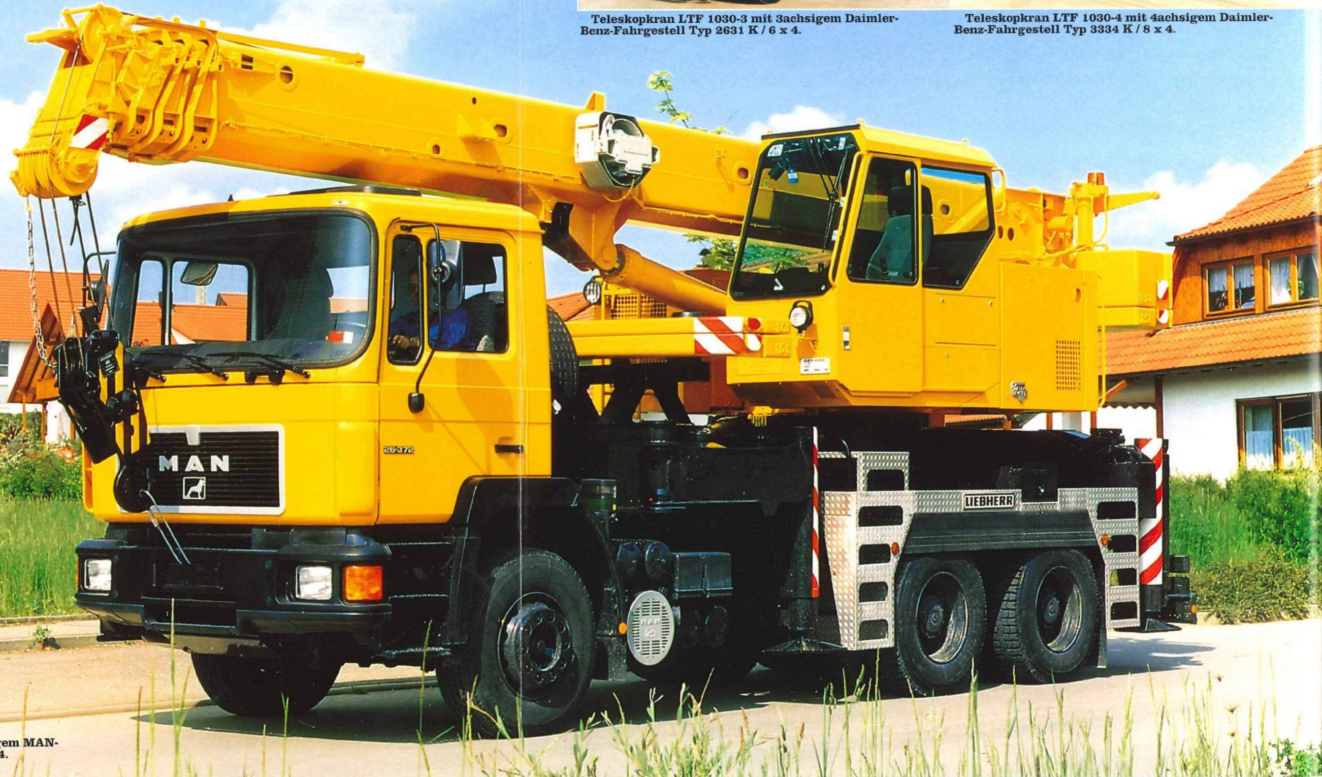
Teleskopkran LTF 1030-3 mit 3achsigen MAN-Fahrgestell Typ F 09 26/27.372 DF 6 x 4.

Die Aufbaukrane mit den Fremdfahrgestellen - eine Klasse für sich.