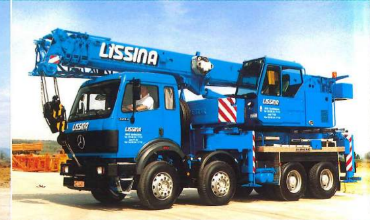
Teleskopkran LTF 1030-4 mit 4achsigen Daimler-Benz-Fahrgestell Typ 3334 K / 8 x 4.