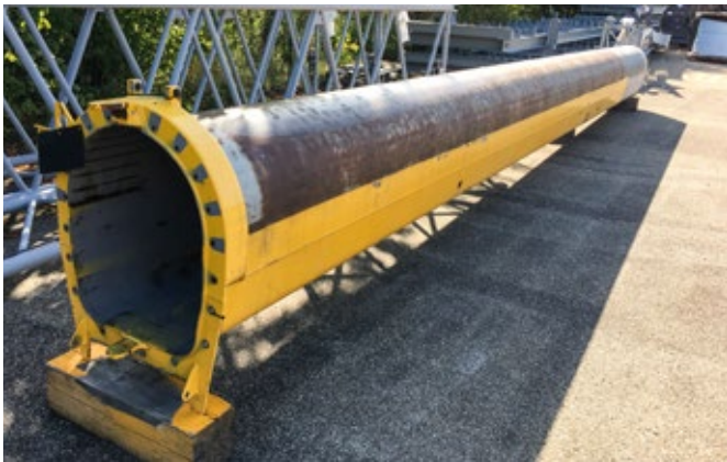
Einzelne Teleskopsektionen oder Teleskoperweiterungen