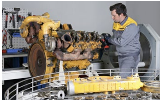
Fachmännische Motorenüberholung durch Liebherr-Spezialisten