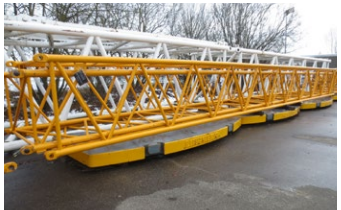
Ausrüstungsteile wie Gittersektionen, Hilfsausleger und Klappspitzen