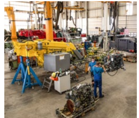
Austausch des Oberwagenmotors und Instandsetzung der Drehbühne