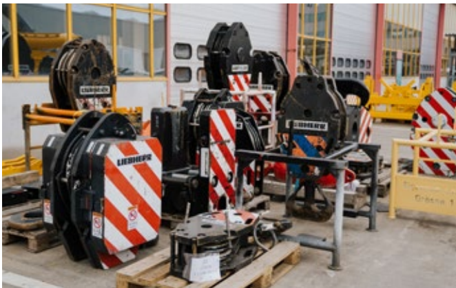
Lasthaken und Hakenflaschen in verschiedenen Varianten