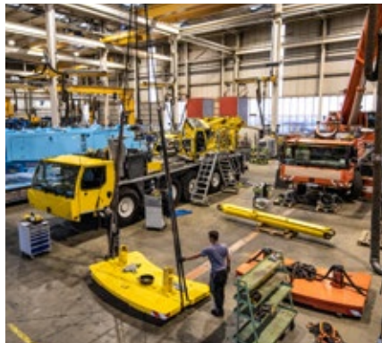
Komplette Demontage des Krans