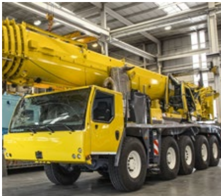
Instandsetzung eines Unfall-Kranks