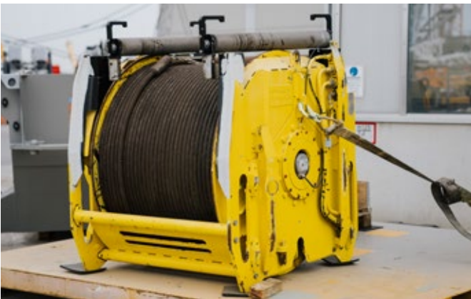
Hubseil- und Windenüberprüfung für die UVV-Prüfung nach §26 BGV D6