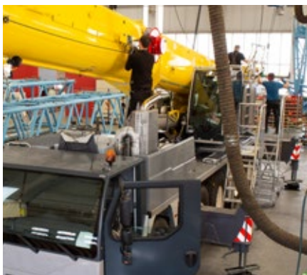
Zusammenbau nach Wiederaufbereitung der Komponenten