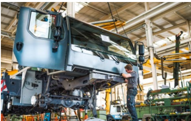
Liebherr-Mitarbeiter mit Erfahrung, Geschick und Fachwissen nehmen die gebrauchten Krane genauestens unter die Lupe