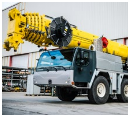
Der komplettierte LTM 1130-5.1 verlässt die Reparaturhalle