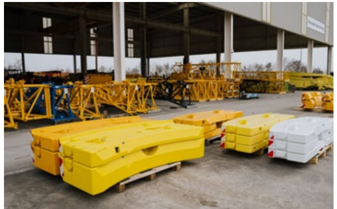
Gegengewichte in unterschiedlichen Ausführungen