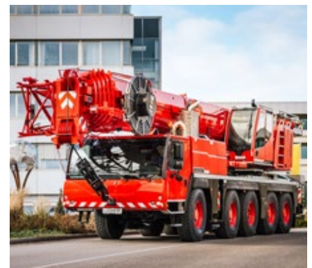
Der überholte und neu lackierte Gebrauchtcrane auf dem Weg zu seinem neuen Besitzer