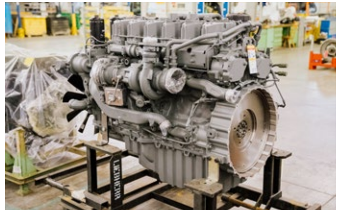
Fachwissen vom Hersteller bei der Motorenüberholung