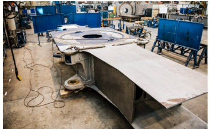
Vorbereitung eines Rahmenteiles für die Unfallinstandsetzung