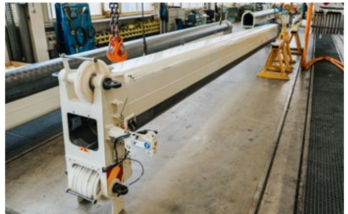
Instandsetzung eines Teleskopauslegers