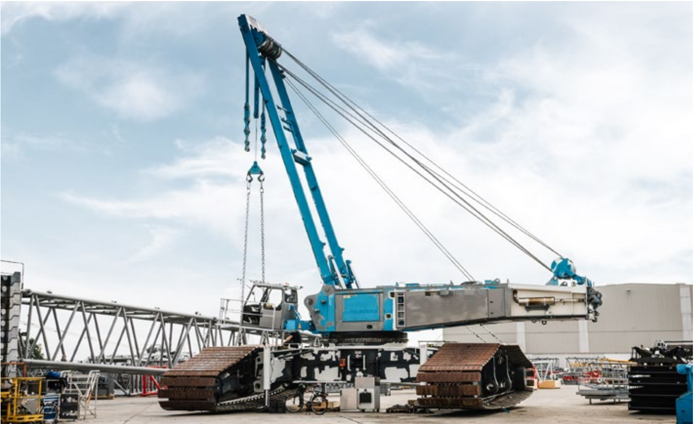
Detaillierte Kontrolle und Abnahme der Komponenten