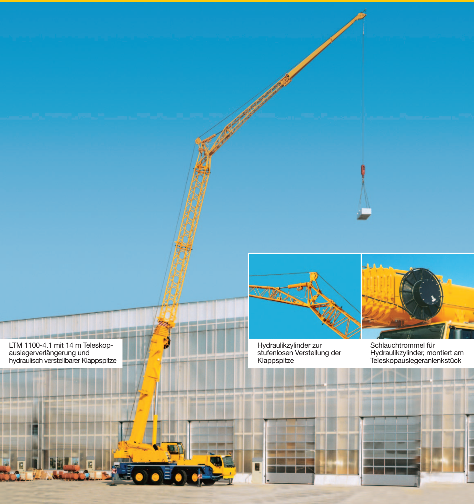
LTM 1100-4.1 mit 14 m Teleskopauslegerverlängerung und hydraulisch verstellbarer Klappspitze

Für Mobilkrane Typ LTC 1055-3.1, LTM 1090-4.1, LTM 1100-4.1, LTM 1100-5.1, LTM 1220-5.1 und LTM 1250-6.1