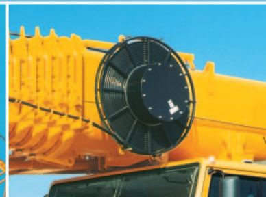
Schlauchtrommel für Hydraulikzylinder, montiert am Teleskopauslegeranlenkstück